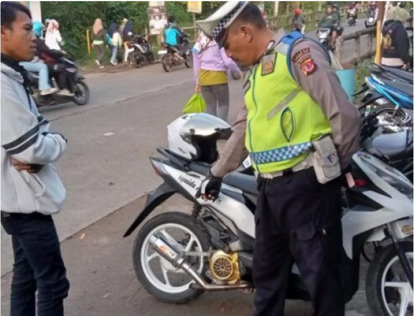
Polsek Sukalarang Polres Sukabumi Kota

Kota Sukabumi – Polres Sukabumi Kota Polda Jawa Barat – Antisipasi tindak