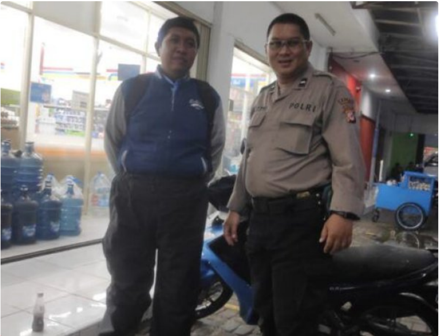
Polsek Kebon Pedes Polres Sukabumi Kota

Kota Sukabumi – Polres Sukabumi Kota Polda Jawa Barat, Polsek Kebon Pedes